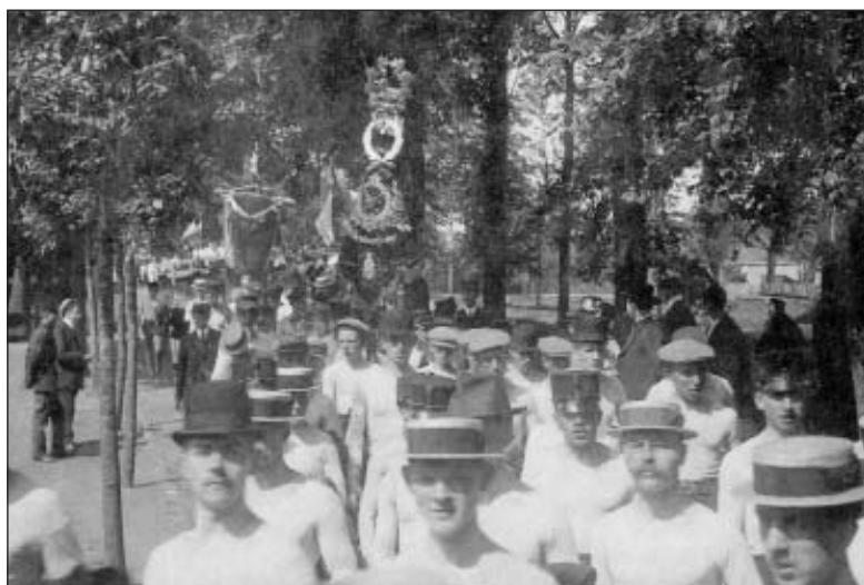
Optocht van gymnastiekvereniging UDI-WVO.