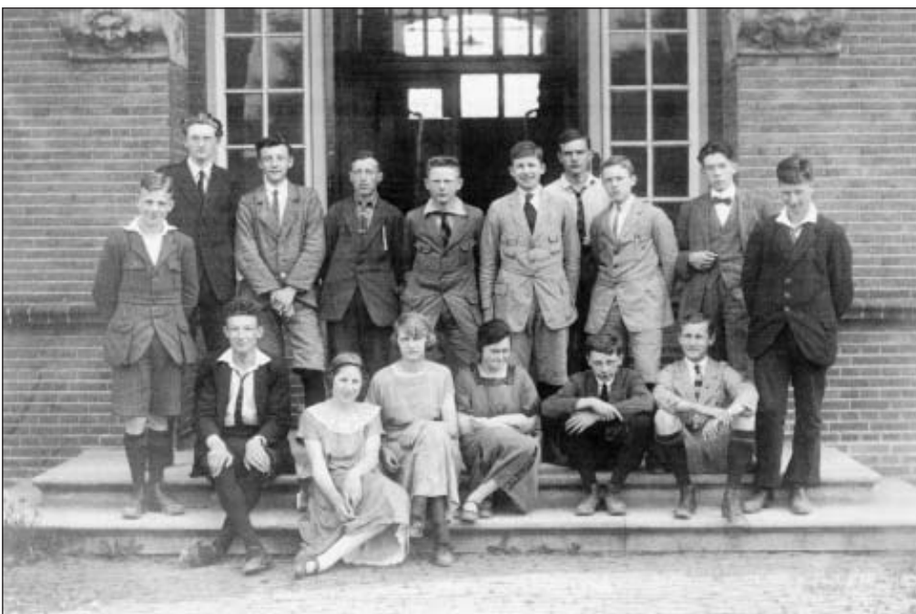
Afbeelding 1. Foto van een klas van de Hoornse H.B.S.

Ik noteer alleen de namen die bekend zijn aan de hand van de schets, zie volgende bladzijde.