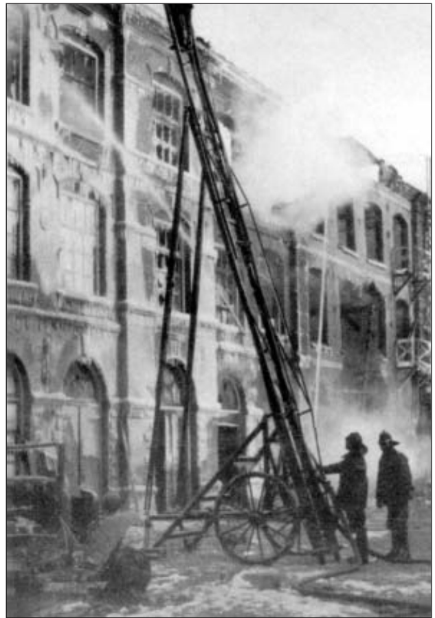
29 januari 1941 - De brand in het kazernegebouw aan het binnenplein bij de Veemarkt achter Garage Leeuw en Vink wordt geblust. De biljartvereniging Horna en de turnvereniging zijn hun onderkomen kwijt.