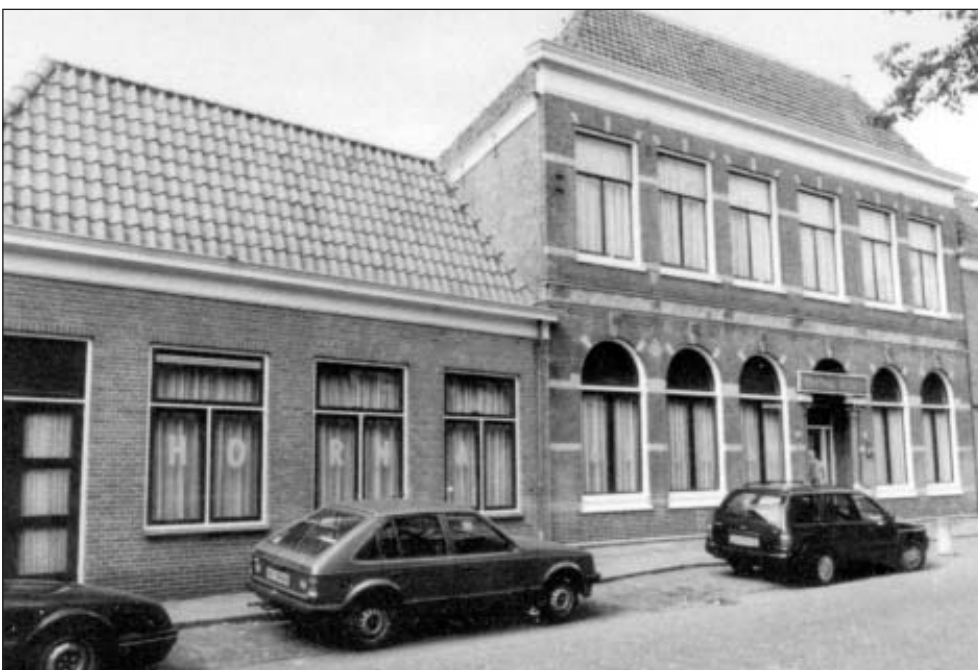
Achterom 53. Het clubhuis van Horna. De twee dakkapellen met bijzondere zinken kappen zijn helaas bij het opknappen van de zolder in 1988 spoorloos verdwenen.

Nu zult u zich misschien afvragen, zijn er helemaal geen dames die biljarten? Want totnogtoe komen er in het hele verhaal geen vrouwen voor. Wel dames die schoonmaken en drankjes inschenken. Nou, op 25 augustus 1989 vormen 14 vrouwen een groep die op de vrijdagavond gelegenheid krijgt te spelen. Een