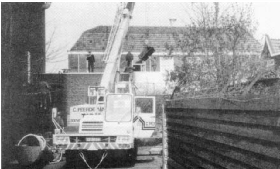
Maart 1990. Met een kraan worden de nieuwe biljarts aan de achterkant van het pand Achterom 53 naar binnen gebesen.

Op 29 januari 1941 brandt de biljartzaal helemaal uit. Het is oorlog en een bijzonder koude winter. De volgende dag hangt het bluswater in ijspegels van de